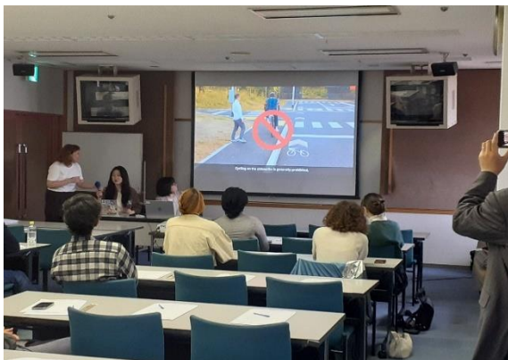
京都市職員による講習の様子（英語）