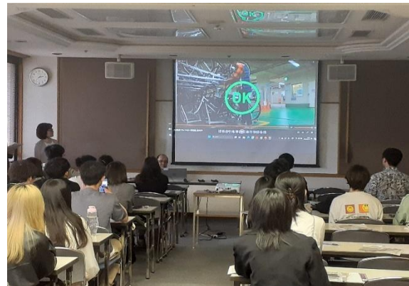
京都市職員による講習の様子（中国語）